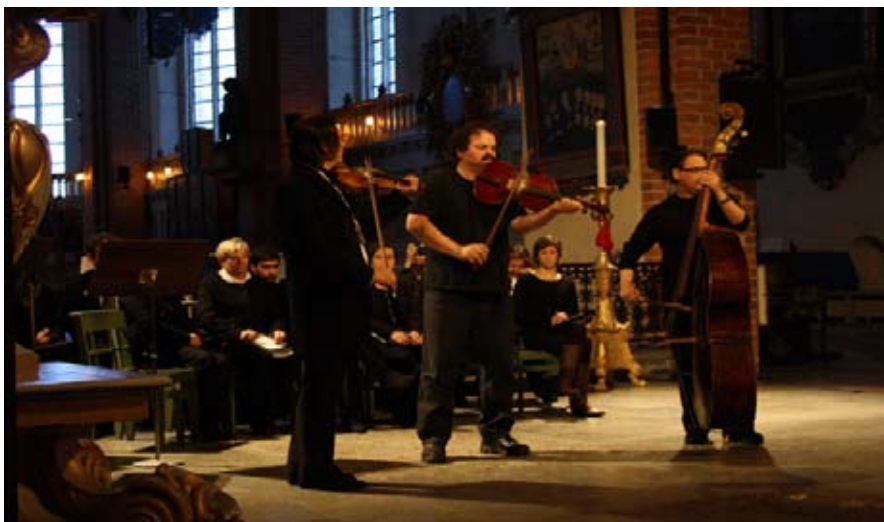
A Barozda régizene és népzene együttes siratót játszik