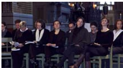
A Stockholmi Magyar Kamarakórus tagjai