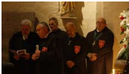
A Szent György Lovagrend tagjai